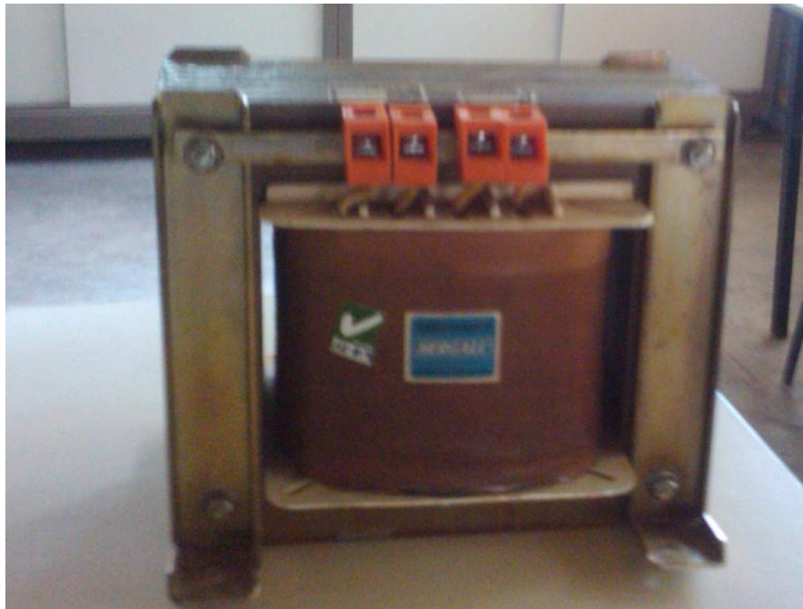
Figura 1: foto ilustrativa del transformador utilizado para el trabajo.

En la etapa inicial de este trabajo, hemos elaborado material didáctico el cual fue publicado en el sitio http://demonstrations.wolfram.com/ con el nombre de Magnetizing Current Waveform in an Ideal Saturable Inductor . (Forma de onda de la corriente de magnetización en un inductor ideal saturado).